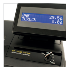
Leicht lesbares Bedienerdisplay