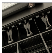
Große und robuste Stahlschublade