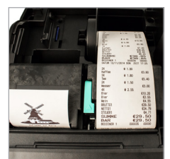
Schneller und leiser Thermodrucker