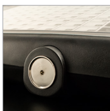
Integriertes Dallas Kellerschloß