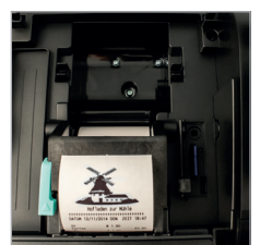
Schneller und leiser Thermodrucker