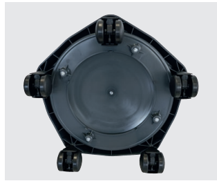
5 Lenkrollen für Stabilität und Wendigkeit