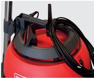
Griff mit Kabelhalter und Kabelzugentlastung