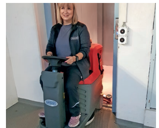
Schmale Bauweise, passt in jeden Personenaufzug