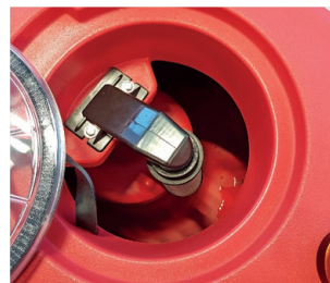
Schmutzwassertank, einfach zu reinigen