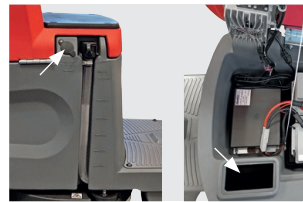
Einfüllöffnung (Schlauch oder Eimer) und Skala für Frischwassertank