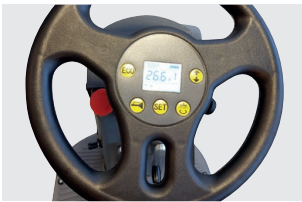
Lenkrad mit integriertem Display