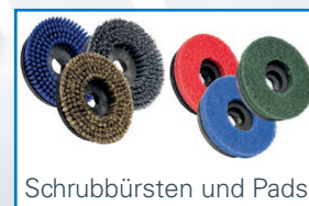
Schrubbürsten und Pads