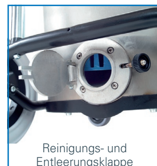
Reinigungs- und Entleerungsklappe