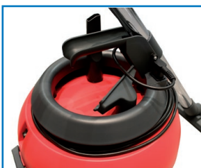
Griff und Kabelzugentlastung